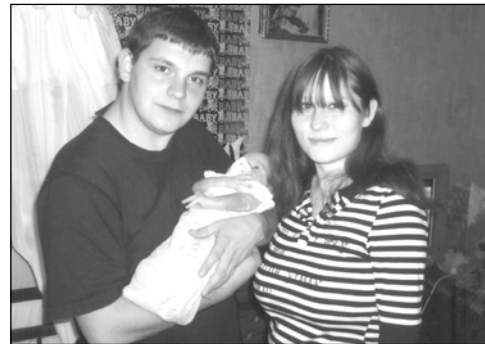
Студенты 4 курса факультета СО.