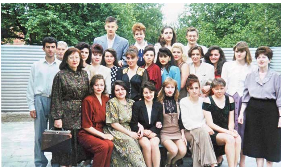
Первый выпуск студентов АЛУ: факультет «Лингвистика», в головном вузе г. Армавира в 1997 году.