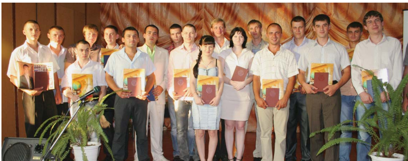
Выпускники 2010 года, юридический факультет, Усть-Лабинский филиал.