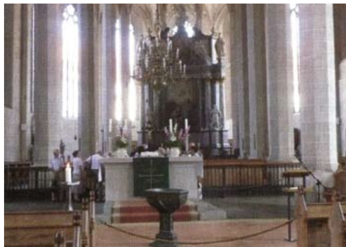
Dom St. Petri - Simultankirche mit evangelischem und katholischem Altar

Pfeifen machen ihn zu einem architektonischen Kleinod 4 von außergewöhnlicher Schönheit. Seit 1524 ist der Dom Simultankirche 5 : Im Chorraum findet der katholische Gottesdienst statt, der vorwiegend von sorbischen Christen besucht wird, im Langhaus des Domes feiern die protestantischen Christen ihren Gottesdienst. So ist der Dom Symbol für das friedliche Miteinander und für die geistliche Toleranz von Sorben und Deutschen.