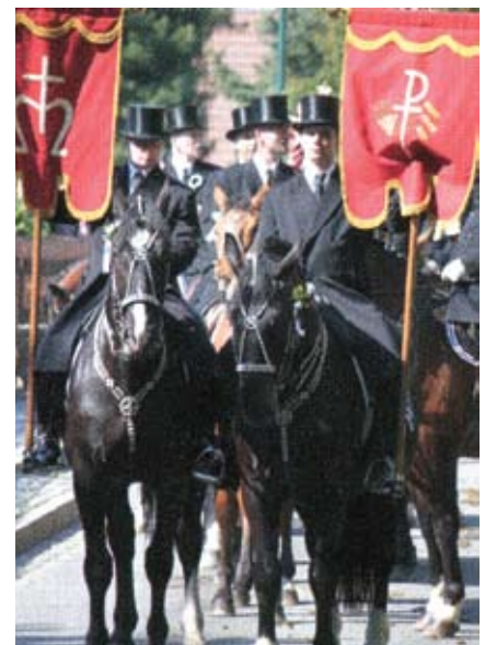
Osterreiter in Nebelschütz - Landkreis Bautzen

Eine weitere Besonderheit in der Stadt ist der Reichturm aus dem 15. Jahrhundert. 1620 zerstört, wurde er im 18. Jahrhundert wieder aufgebaut. Jedoch scheint er beim Bau etwas „aus dem Lot geraten“ zu sein, er neigt sich 1,44 m nach Nordwesten, so dass er als der „schiefe Turm von Bautzen“ gilt. Weit verbreitet ist der Brauch zum Osterfest, Ostereier bunt zu bemalen. Von Ort zu Ort herrscht ein Wettstreit um das schönste Osterei. Höhepunkt des Osterfestes ist das „Osterreiten“ am Ostersonntag. Dieser Brauch stammt aus dem Mittelalter. Seit dieser Zeit reiten junge Männer von Dorf zu Dorf, von Bauernhof zu Bauernhof und bringen den Menschen die frohe Botschaft von der Auferstehung unseres Herrn Jesus Christus. An dem Ritt um die Felder in jedem Dorf auf geschmückten Pferden nehmen alljährlich etwa 1000 Reiter teil.