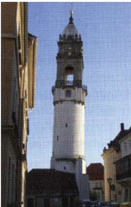
Reichenturm in Bautzen

Auf dem Gelände der Burg befindet sich ein technisches Kunstwerk aus dem Jahr 1588, die „Alte Wasserkunst“: ein 50 m hoher Turm, der Teil der Wehranlage 6 der Burg war und gleichzeitig dazu diente, Wasser aus der Spree auf das Burggelände zu leiten. Dieses technische Meisterwerk mit Pumpanlage ist noch voll funktionsfähig und wird den Touristen vorgeführt.