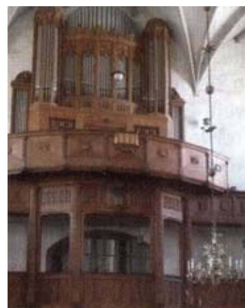
Orgel im Dom St. Petri

1648. Der prächtigste Bau in der Altstadt ist wohl der gotische Dom St. Petri aus dem 13. Jahrhundert, der zu Sachsens bedeutendsten Kirchen gehört. Das einzigartige Sternengewölbe im Mittelschiff, das Langhaus mit auffallend schlanken Pfeilern, das kunstvoll geschnitzte Chorgestühl und die mächtige Orgel mit 400