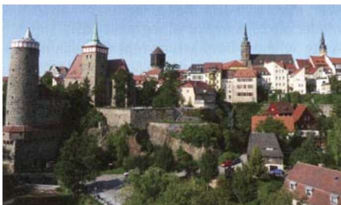
Blick auf Bautzen: Alte Wasserkunst, Michaeliskirche, Alter Wasserturm, Dom St. Petri, Rathaus (v. l. n. r.)

Die Stadt Bautzen, zwischen Dresden und Görlitz in der Oberlausitz gelegen, ist eine der ältesten Siedlungen Europas. Archäologen sind bei Ausgrabungen auf ein Frauengrab aus der frühen Bronzezeit (1800-1500 v. Chr.) gestoßen und haben etwa 300 Bernsteinperlen aus diesem Grab geborgen. Um 500 nach Chr. siedelten sich in diesem Gebiet die Sorben, ein slawischer Volksstamm, an, die sich nach langen Kämpfen der Ostexpansion germanischer Stämme beugen 1 mussten. Jedoch blieben die Sorben weiterhin in der Oberlausitz wohnen. Die Germanen errichteten die