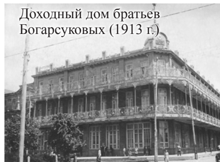
Доходный дом братьев Богарсуковых (1913 г.)