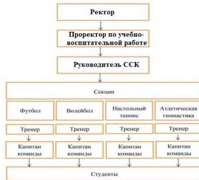
Схема 1 – Структура ССК НЧОУ ВО АЛСИ

3.3. Формы организации работы указанного спортивного клуба определяются спортивным клубом в соответствии со спецификой основных направлений его деятельности, а также с учетом состояния здоровья обучающихся.